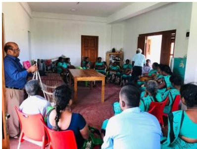
Training door overheid

Tegelijk was er ook in 2019 groei in kwaliteit op de boerderij, groei in visie en strategie voor de bedrijfsvoering, groei in samenwerking met andere organisaties, lokale overheid en lokale kerken.