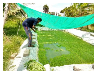
Azzola – goed voor de geiten