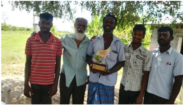
Team trots met de prijs