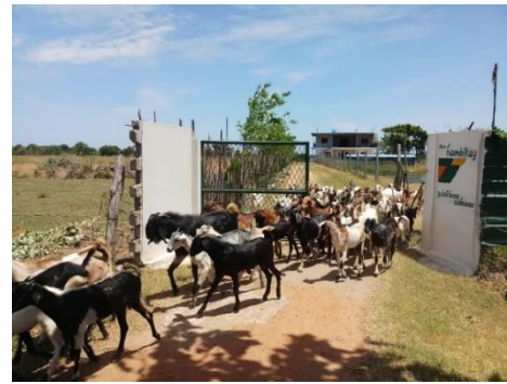
De kudde geiten

Een aantal maanden heeft een jongere uit Mannar, in de tijd dat hij op zijn examenresultaat wachtte, zich ingezet als vrijwilliger op de boerderij. Enorm enthousiast, hardwerkend en creatief. We kijken dankbaar op zijn inzet terug! En hopen dat hij een inspiratie is voor andere jongeren.