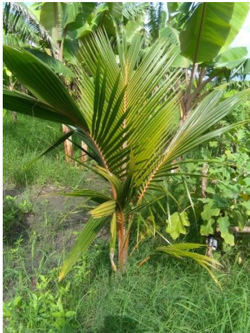
Kokospalm en bananenboom

Op het terrein van de boerderij zijn in 2017 meer jonge fruitbomen geplant, zoals mango, kokospalm, papaja, lime, bananen. Naast het feit dat dit in de toekomst fruit geeft, geven de bomen ook schaduw en breken zij de wind.