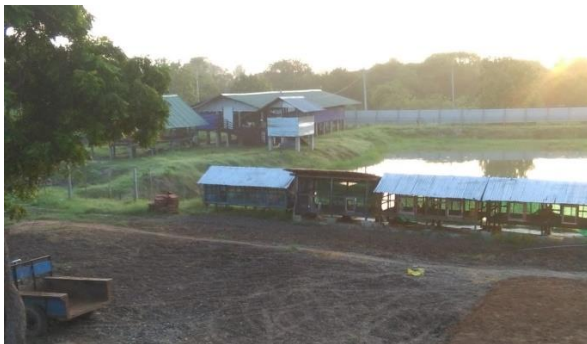
Overzichtsfoto Farm of Nambikay

Er zijn 45 volwassen geiten aangekocht, met daarbij 40 kleine geitjes. Daarmee is een goede start gemaakt van een geitenkudde. In 2017 werden 67 geitjes geboren. Ook werden vanaf augustus de eerste geiten verkocht, 30 kleine en volwassen geiten. Met de focus op geiten merken we dat al in 2017 meer maanden positief werden afgesloten, dus meer inkomsten dan uitgaven ten opzichte van de lopende kosten.