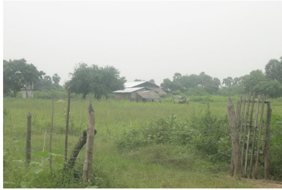
overzicht Farm of Nambikay

Hoewel het team een moeilijk jaar heeft gehad waren er ook goede momenten. Er is veel interesse voor de boerderij in de regio van lokale boeren, veeartsen, overheid, (internationale) organisaties en andere geïnteresseerden. Regelmatig komt bezoek langs; Farm of Nambikay is het eerste boerenbedrijf dat op deze manier melkvee houdt. De lokale boeren willen graag meer weten. Ook verwijzen de veeartsen mensen naar Farm of Nambikay voor meer informatie over het houden van melkvee. Daarnaast kon Farm of Nambikay in 2014 een werkleerplek bieden aan een jongvolwassene met beperkingen, om zo bij te dragen aan zijn toekomstmogelijkheden en integratie in de samenleving.