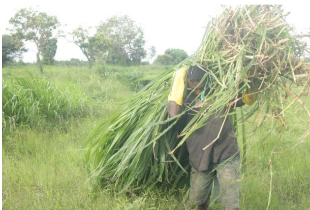
Olifantsgras voor voer

Terugkijkend is 2014 een leerzaam jaar geweest, maar door de hierboven geschetste tegenslagen kunnen we als stichting Boerderij van Nambikay constateren dat er een jaar verlies is in vergelijking met de planning van opbouw en uitbreiding van Farm of Nambikay . Daardoor zal 2015 ook ingezet worden als een jaar van opbouw en uitbreiding. Het is onze doel om in 2015 een hogere melkproductie per koe te realiseren. Dit willen wij bereiken door een betere kwaliteit koe aan te kopen en door het verbeteren van het farm-management. Daarnaast willen we kijken naar andere inkomstbronnen, door cultivatie van gewassen als chili en pinda's en door het kweken van vissen. In 2015 zal een nieuwe coördinator de dagelijkse leiding op Farm of Nambikay op zich nemen.