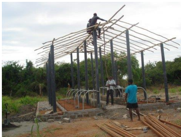
bouw stal voor koeien