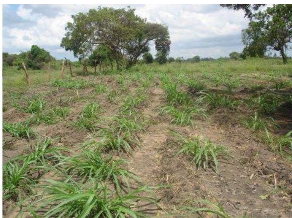
Planten van olifantsgras

Met de eerste fondsen is het land bewerkt en is er een stal voor als onderkomen voor de eerste tien koeien gebouwd. Vanaf augustus 2013 zijn negen koeien en een stier gekocht, waarvan een deel dagelijks wordt gemolken en een deel drachtig is. De melk wordt verkocht aan het melkverzamelstation, die de melk doorverkoopt aan de melkfabriek. Dit zijn de eerste inkomsten van Farm of Nambikay , maar we zien 2013 als een eerste investeringsjaar. De inkomsten zijn met dit aantal koeien nog te laag om een positieve balans te kunnen verwezenlijken.