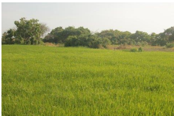
2012 land met rijstverbouw

In oktober 2012 is Farm of Nambikay gestart in Sri Lanka . In de afgelopen veertien maanden is er enorm veel gebeurd.