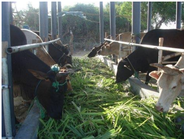
Augustus 2013: de eerste koeien op stal

Een klein en enthousiast team is verantwoordelijk voor de dagelijkse zorg voor de koeien en het organiseren van de boerderij. Daarnaast is de coördinator ook in contact met andere betrokkenen, zoals lokale boeren, veeartsen, overheid, en geïnteresseerden. Regelmatig komt bezoek langs, Farm of Nambikay is het eerste boerenbedrijf dat op deze manier melkvee houdt. De lokale boeren willen graag meer weten. Ook verwijzen de veeartsen mensen naar Farm of Nambikay voor meer informatie over het houden van melkvee. De melkproductie is voor deze omgeving al meer dan gemiddeld (4-7 liter/dag/koe). Het is onze wens om in 2014 een hogere melkproductie per koe te realiseren. Dit willen wij bereiken door een betere kwaliteit koe aan te kopen en door het verbeteren van het farm management.