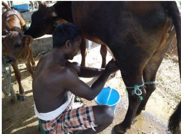
.. en het melken van de koeien