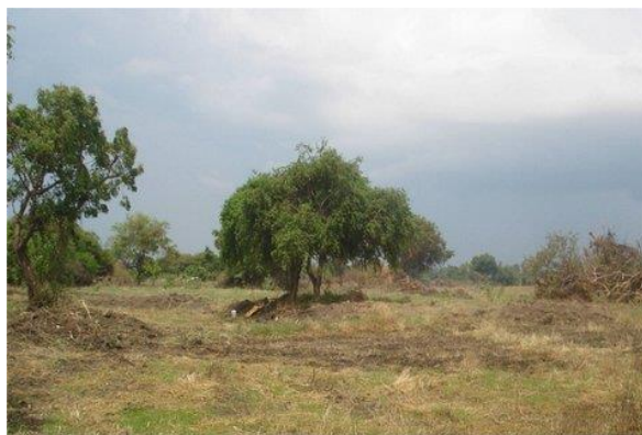
eind 2012/begin 2013 land geschikt maken voor gras

Met de eerste fondsen is het land bewerkt en is er een stal voor als onderkomen voor de eerste tien koeien gebouwd. Vanaf augustus 2013 zijn negen koeien en een stier gekocht, waarvan een deel dagelijks wordt gemolken en een deel drachtig is. De melk wordt verkocht aan het melkverzamelstation, die de melk doorverkoopt aan de melkfabriek. Dit zijn de eerste inkomsten van Farm of Nambikay , maar we zien 2013 als een eerste investeringsjaar. De inkomsten zijn met dit aantal koeien nog te laag om een positieve balans te kunnen verwezenlijken.